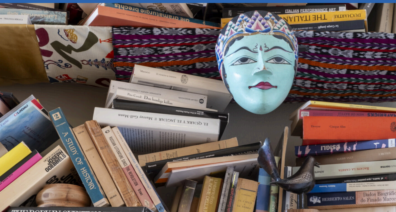
LAF LIS, BIBLIOTECA BERNARDINI, LO SPAZIO DEI LIBRI