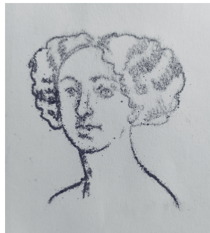
Aphra Behn 1640-1689